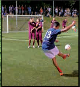
AZIONE GIOCO DELLA FINALE COPPA DEL MONDO AMIA