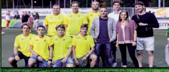
LO STAFF AREASPORT/ASI VERONA