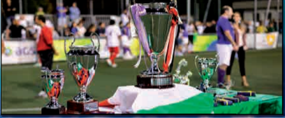
I TROFEI CHAMPIONS ED EUROPA LEAGUE DI VERONA PREMIA