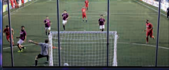
AZIONE DI GIOCO FINALE EUROPA LEAGUE