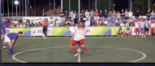
IL CALCIO D'INIZIO DELLA FINALE CHAMPIONS LEAGUE