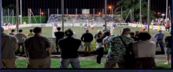
IL CENTRO DE STEFANI GREMITO